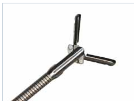
Fremdkörperzange „Rubber Tips“, Branchen mit dicken Gummiflächen zur Bergung von glatten, flachen Gegenständen, autoklavierbar 134° C

Grasping forceps „Rubber Tips“ type, branches with thick rubber surfaces for removal of slippery, flat objects, autoclavable 134° C