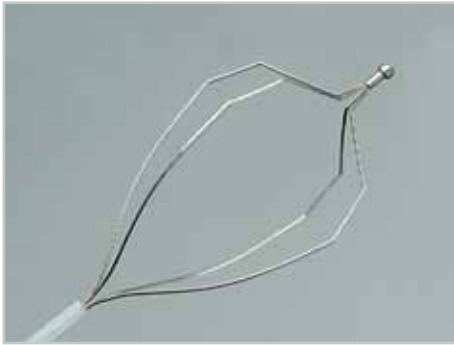
Einweg Fangkörbchen zur Steinextraktion, hexagonal, 4-fach mit Anschlagkopf, Notfall-Lithotripsie geeignet Disposable retrieval basket for stone extraction, hexagonal with stop head, suitable for emergency lithotripsy