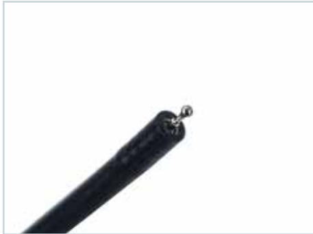
Einweg ESD „Kugel Messer“ zum Markieren, Blutungsstop, Schneiden inkl. Wasserstrahl, Olympus HF Anschluss Disposable ESD „Ball Type Knife“ for marking, stop bleeding, cutting incl. water jet, Olympus HF connection